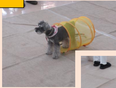
アニマルセラピー